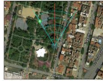
Google Maps (satélite) (nivel 20 /paso 20)