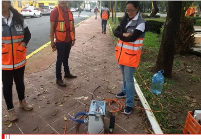
LÍNEA DE 85MTs DE LONGITUD Y 22MTD DE PROFUNDIDAD EFECTIVA