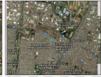
Google Maps (satélite) (nivel 20 /paso 20)