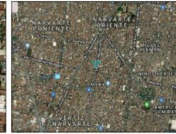
Google Maps (satélite) (nivel 20 /paso 20)