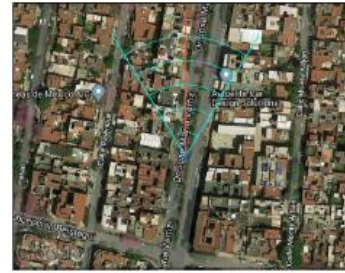
Google Maps (satélite) (nivel 20 /paso 20)