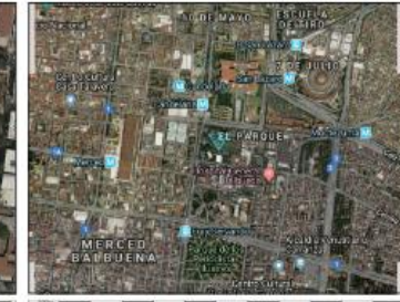
Google Maps (satélite) (nivel 20 /paso 20)