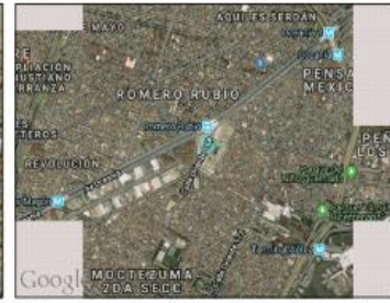
Google Maps (satélite) (nivel 20 /paso 20)