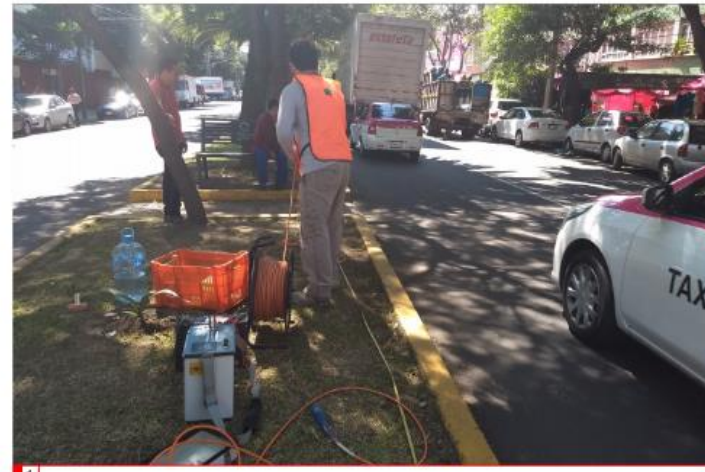
LÍNEA DE TOMOGRAFÍA ELÉCTRICA DE 115 MTS Y 22 METROS DE PROFUNDIDAD EFECTIVA