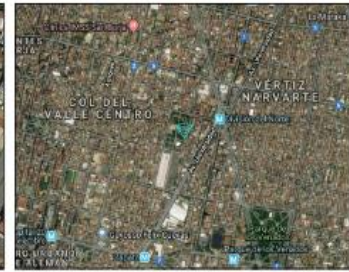
Google Maps (satélite) (nivel 20 /paso 20)