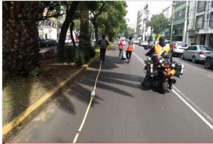
1 PROSPECCIÓN CON GPR ANTENA RITA DE 30MHZ .