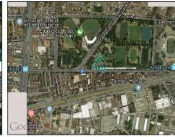
Google Maps (satélite) (nivel 21 /paso 20)