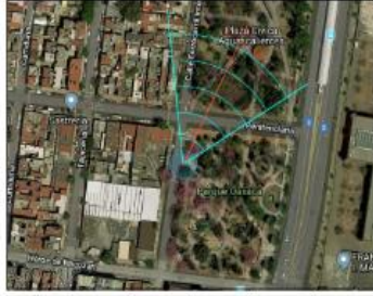
Google Maps (satélite) (nivel 20 /paso 20)