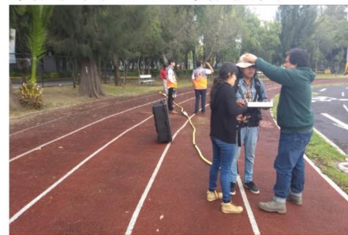
1 PROSPECCIÓN CON GPR ANTENA RITA DE 30MHZ .