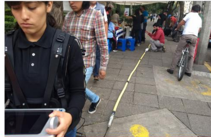
1 PROSPECCIÓN CON GPR ANTENA RTA DE 30MHZ .