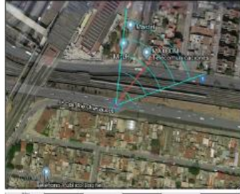
Google Maps (satélite) (nivel 20 /paso 20)