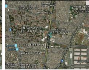
Google Maps (satélite) (nivel 20 /paso 20)