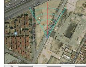
Google Maps (satélite) (nivel 20 /paso 20)