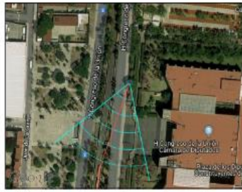
Google Maps (satélite) (nivel 20 /paso 20)