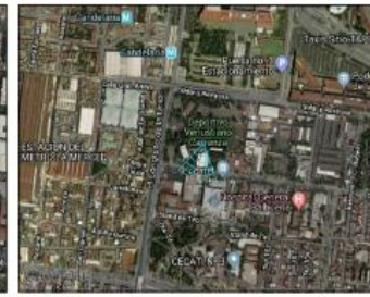
Google Maps (satélite) (nivel 20 /paso 20)