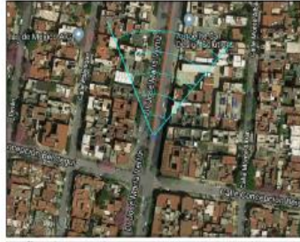
Google Maps (satélite) (nivel 20 /paso 20)