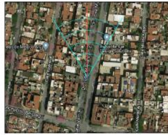
Google Maps (satélite) (nivel 20 /paso 20)