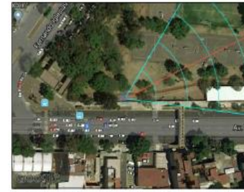
Google Maps (satélite) (nivel 21 /paso 20)