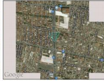
Google Maps (satélite) (nivel 20 /paso 20)