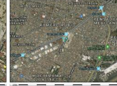
Google Maps (satélite) (nivel 20 /paso 20)