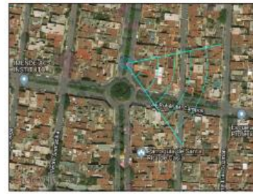
Google Maps (satélite) (nivel 20 /paso 20)