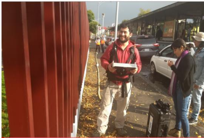
1 PROSPECCIÓN CON GPR ANTENA RTA DE 30MHZ .

Proyecto: CDMX PROTECCION CIVIL Selección:[auto] Todas las fotos Ubicación: CALLE XOCONGO Y MATEOS