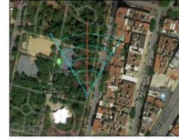
Google Maps (satélite) (nivel 20 /paso 20)