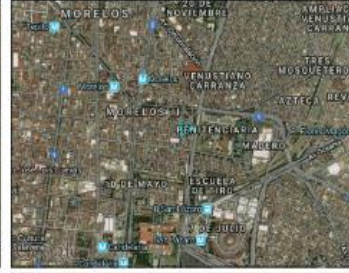
Google Maps (satélite) (nivel 20 /paso 20)